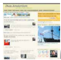
● Site Ducs Amsterdam ducsamsterdam.net

Também dedica boa parte do seu tempo conversando com leitores e respondendo a dúvidas. O que não surpreende que alguns tenham se tornado bons amigos. “Muitos seguem minhas dicas e vêm contar depois. Já marquei de encontrar alguns deles e até aconteceu de eu ser reconhecido por acaso no trem. Esta é a parte mais bacana.”