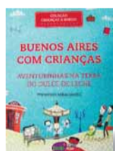
● Buenos Aires com Crianças Editora Pulp R$29,90

reito às mais deliciosas guloseimas, o guia também lista as melhores padarias – que vendem as famosas medialunas (nossos croissants) e churros recheados –, além das sorveterias, destacando ainda os melhores sabores. “O legal é começar pelo tradicional doce de leite e depois provar os mais exóticos. Há várias sorveterias artesanais pela cidade que merecem ser exploradas”, diz.